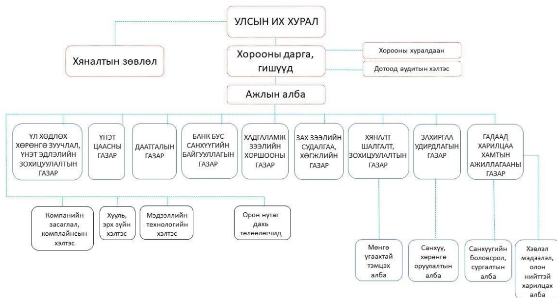
Зураг 1. Бүтэц зохион байгуулалт

Санхүүгийн зохицуулах хороо нь санхүүгийн зах зээлийн тогтвортой байдлыг хангах, санхүүгийн үйлчилгээг зохицуулах, холбогдох хууль тогтоомжийн биелэлтэд хяналт тавих, хөрөнгө оруулагч, үйлчлүүлэгчдийн эрх ашгийг хамгаалах чиг үүрэгтэйгээр Үнэт цаасны болон Даатгалын зах зээлд мэргэжлийн үйл ажиллагаа эрхлэгчид, Хадгаламж зээлийн хоршоо, Банк бус санхүүгийн байгууллага, Зээлийн батлан даалтын сан, Үл хөдлөх эд хөрөнгө зуучлагч, Үнэт металл, үнэт чулууны, эсхүл тэдгээрээр хийсэн эдлэлийн арилжаа эрхлэгч байгууллагуудыг хянан, зохицуулдаг. Хороо нь зохион байгуулалтын 9 газар, 4 хэлтэс, 4 албатай нийт 141 албан хаагчтайгаар үндсэн үйл ажиллагаагаа явуулан ажиллаж байна.