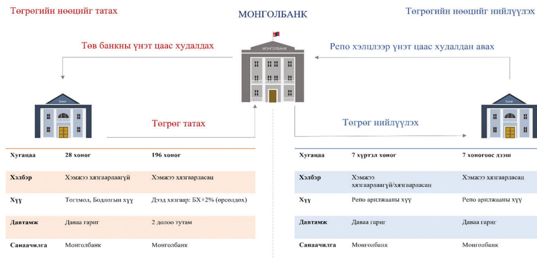
Зураг 1. Нээлттэй захын үйл ажиллагаа

Төв банкны үнэт цаас (ТБҮЦ): Монголбанкны мөнгөний бодлогыг хэрэгжүүлэх үндсэн арга хэрэгсэл юм. Иймд ТБҮЦ-ны анхдагч захын арилжаанд идэвхтэй үйл ажиллагаа явуулж байгаа банкнууд оролцох боломжтой бөгөөд арилжааны төрлийг Монголбанкнаас арилжаа хийх бүрд зарладаг.