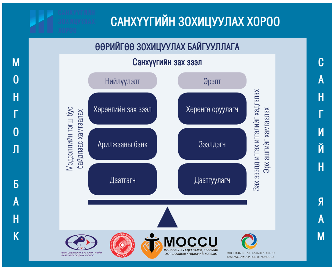
Зураг 2. 1. Монгол Улсын санхүүгийн зах зээлийн хяналт, зохицуулалт

Харин санхүүгийн зах зээлийн бодлого боловсруулалтад Монголбанк, Санхүүгийн зохицуулах хороо болон Сангийн яам гэсэн төрийн эрх бүхий гурван байгууллага оролцдог. Эдгээр гурван байгууллага нь санхүүгийн зах зээлд шинэ бүтээгдэхүүн, үйлчилгээг хөгжүүлэх, дэд бүтэц бий болгох зэрэг асуудлаар бодлогын түвшинд ажлын хэсэг байгуулах, харилцан ойлголцлын санамж бичиг байгуулах эсвэл дундын бодлогын баримт бичиг батлах замаар хамтран ажилладаг.