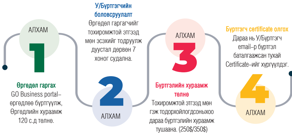
Зураг 5. Сингапурт үнэт эдлэлийн арилжаа эрхлэх тусгай зөвшөөрөл авах процесс

Тусгай зөвшөөрөл автал бүртгүүлж, хүсэлт гаргагч нь улсын бүртгэгчийн зохимжтой этгээд гэж үзэгдэх хүртэл улсын бүртгэгч өргөдлийг хүлээн авснаас хойш 4 долоо хоног хүртэл хугацаагаар судалж үздэг.