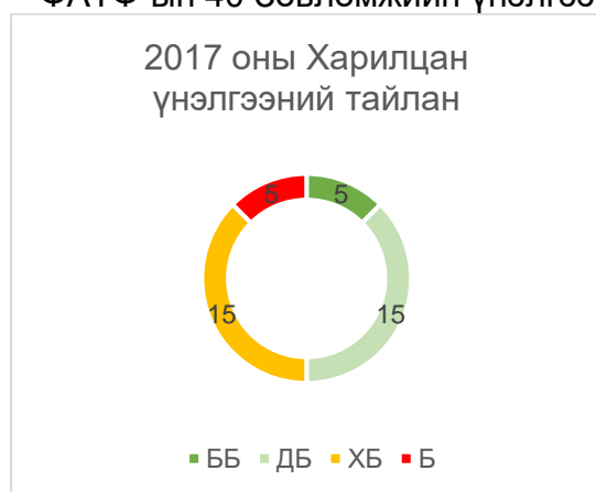
Зураг 1. Монгол Улсын 2017 оны ФАТФ-ын 40 Зөвлөмжийн үнэлгээ