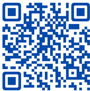
Батлан даалтын гэрээ

Зээлийн гэрээнд холбогдох барьцаа, батлан даалтын гэрээг хавсаргах бөгөөд дараах нөхцөлийг тусгасан байна: